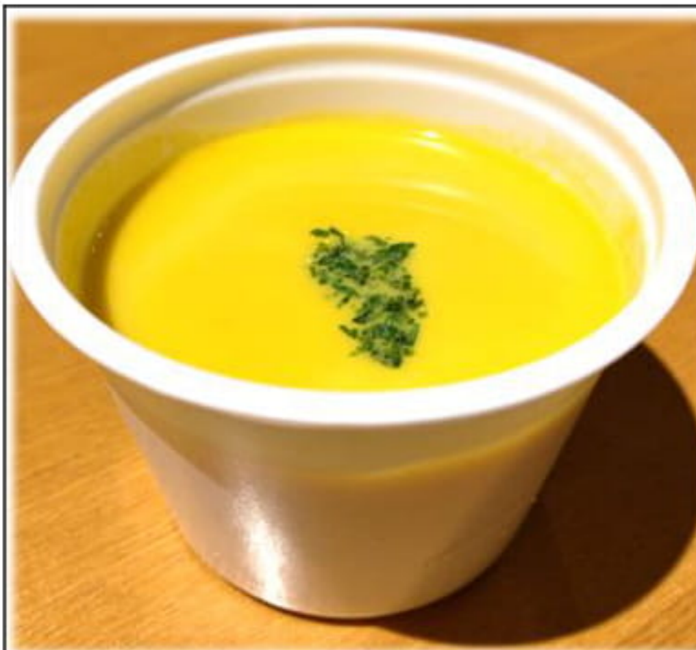
かぼちゃのスープ 温製