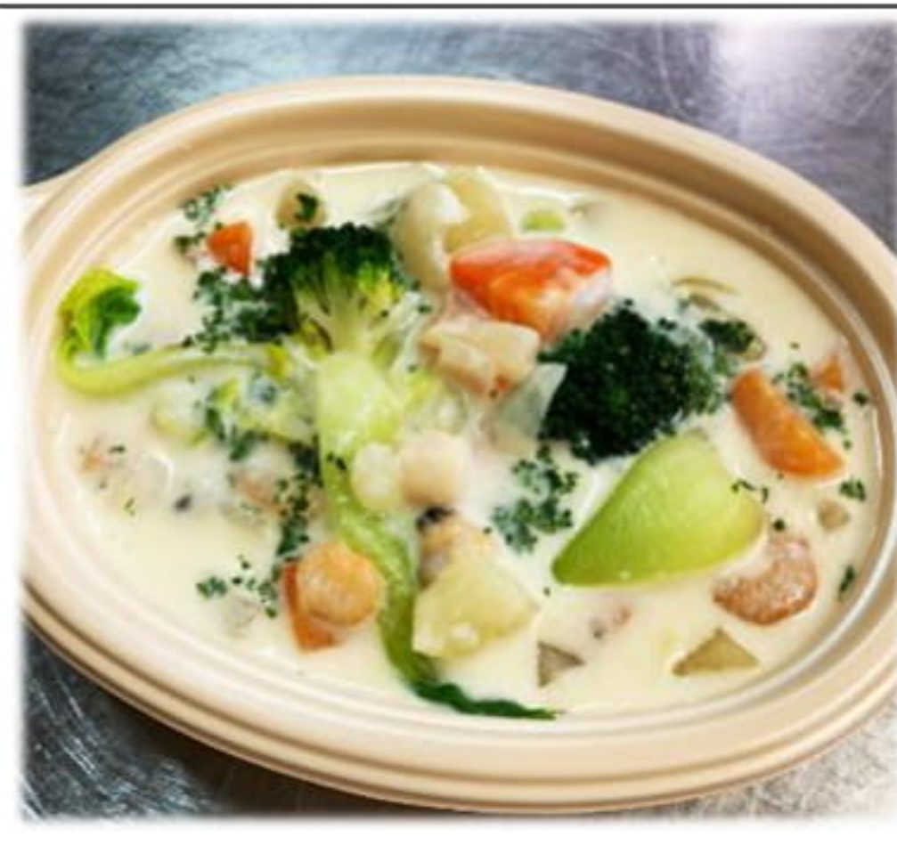
たべる魚介の クリームスープ たっぷり野菜入り