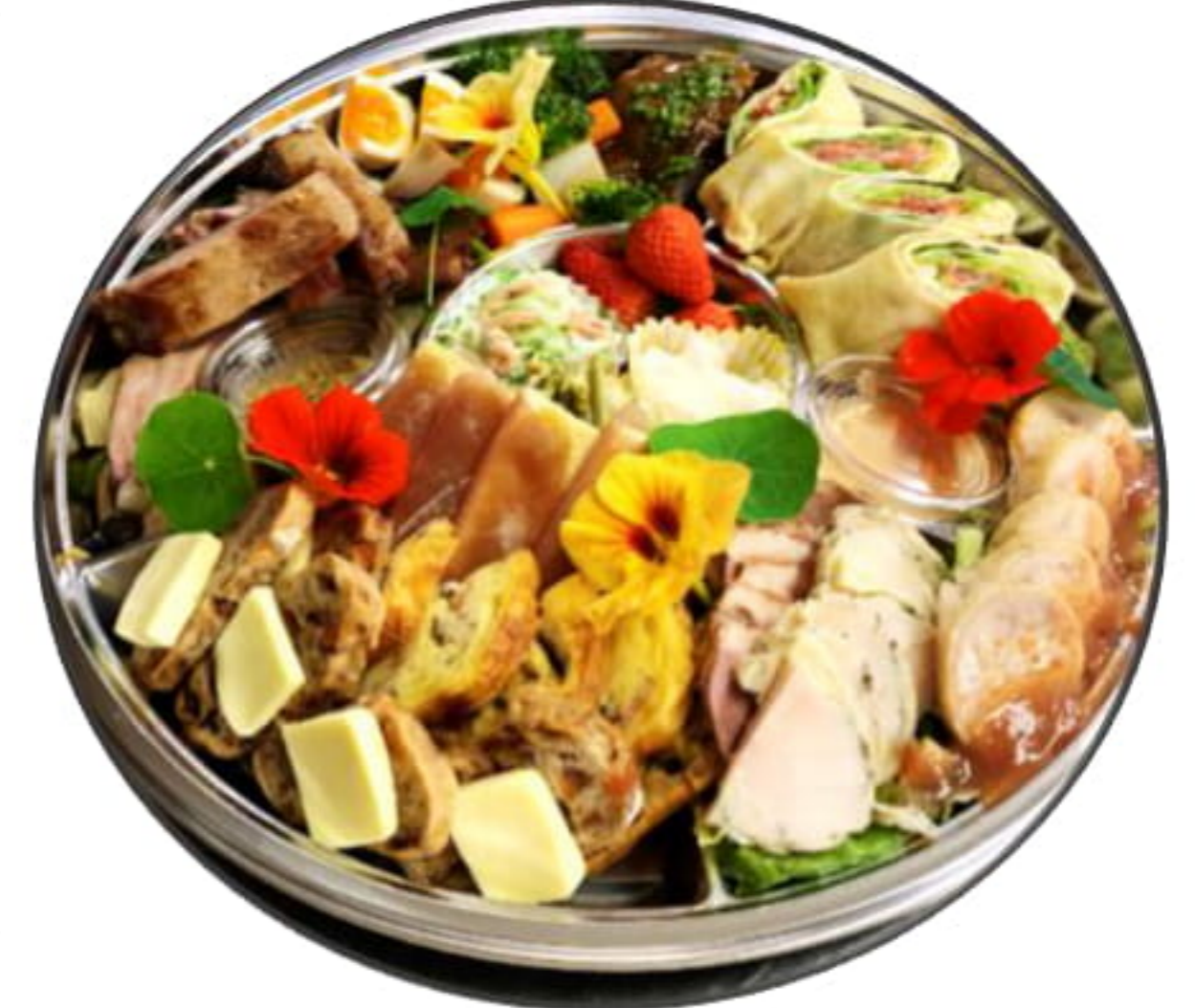
オードブルの盛り合わせ 5000円～ 3日前までのご予約を お願いいたします