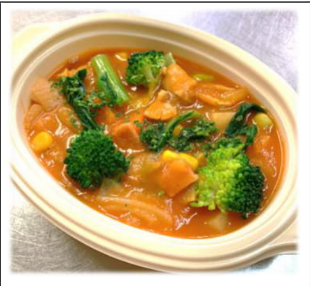
たべるトマトスープ たっぷり野菜入り