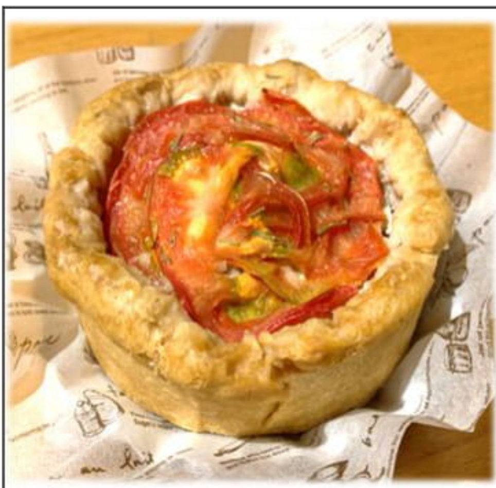
焼きたて! 豚とトマトのタルト