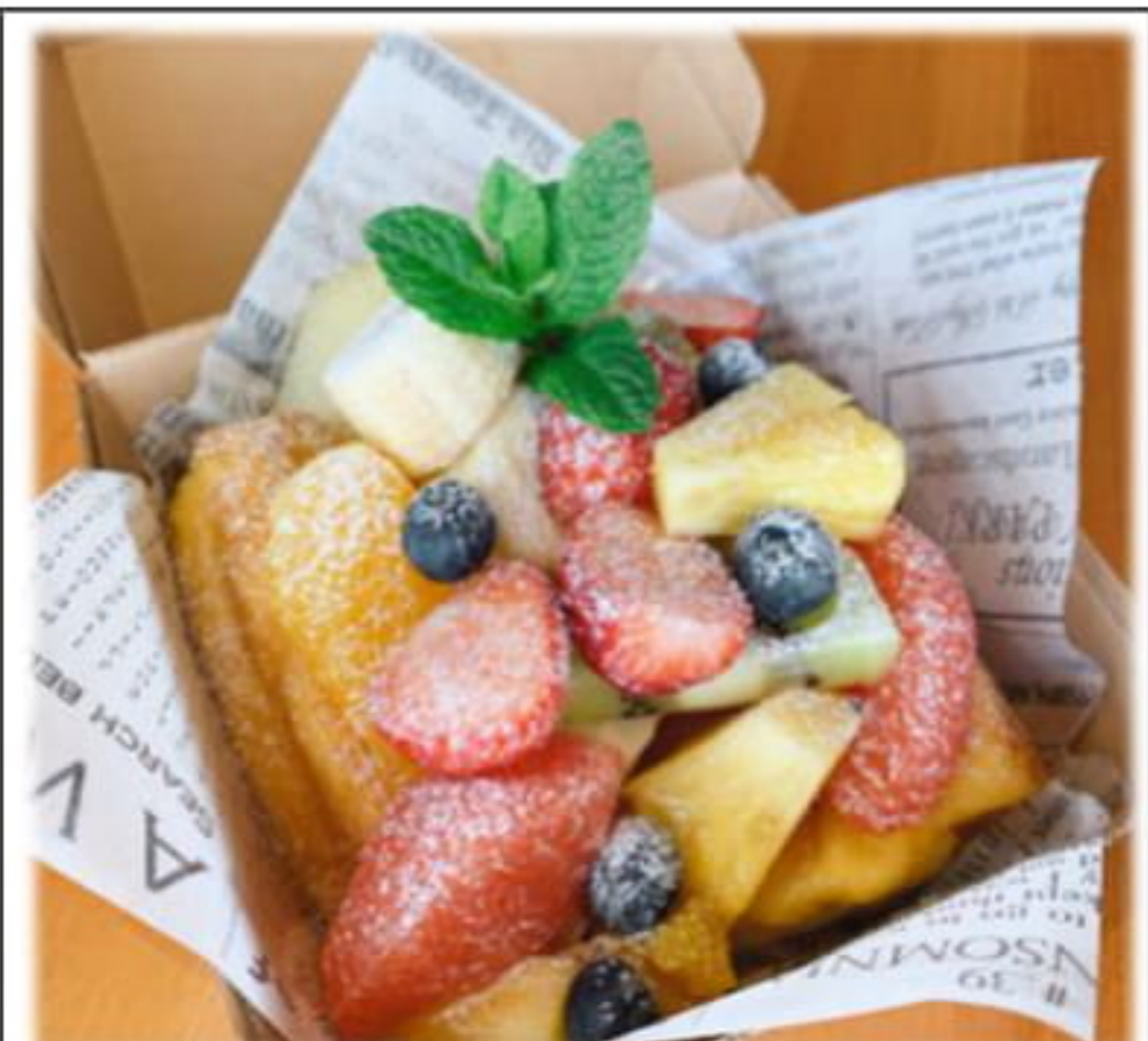
自家製パンの フレンチトースト ハニーメープルソース付