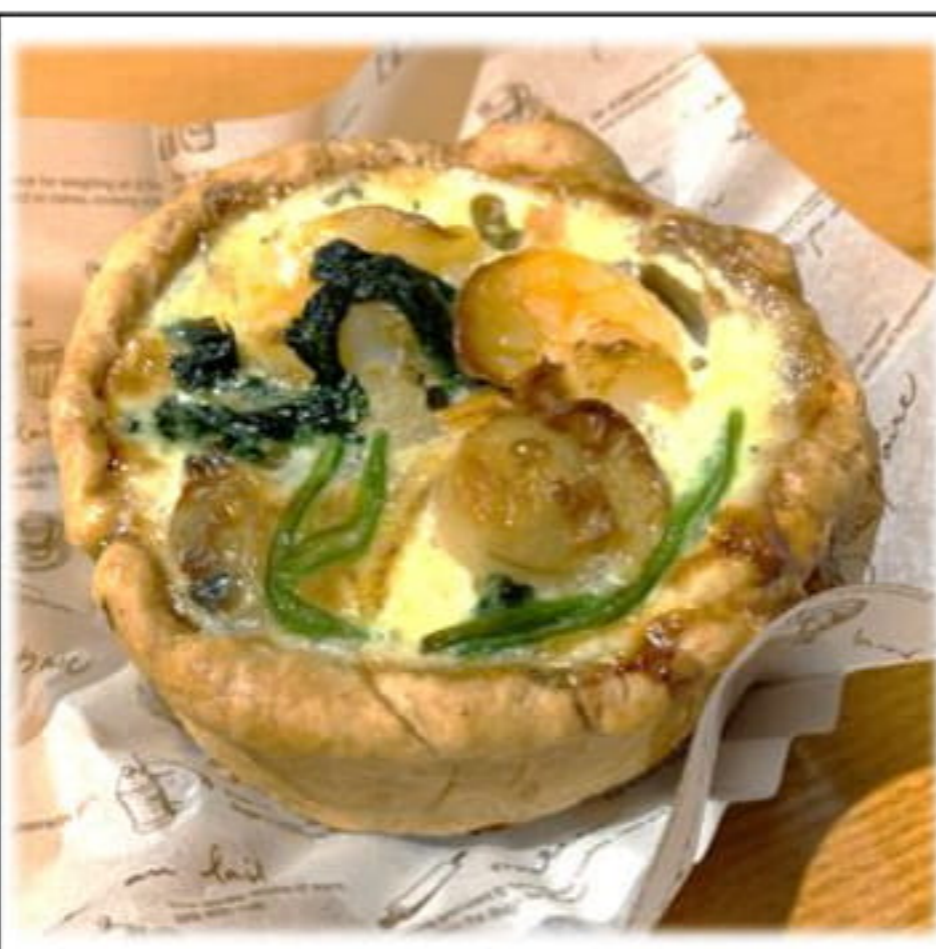
焼きたて! 魚介とほうれん草の キッシュ