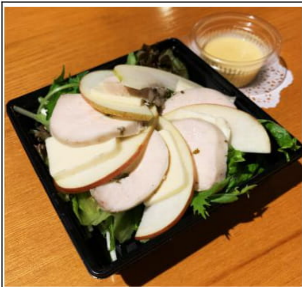
自家製鶏ハムの サラダ りんごとチーズ入り