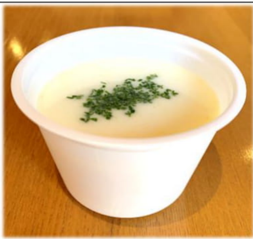
じゃがいものスープ 温製