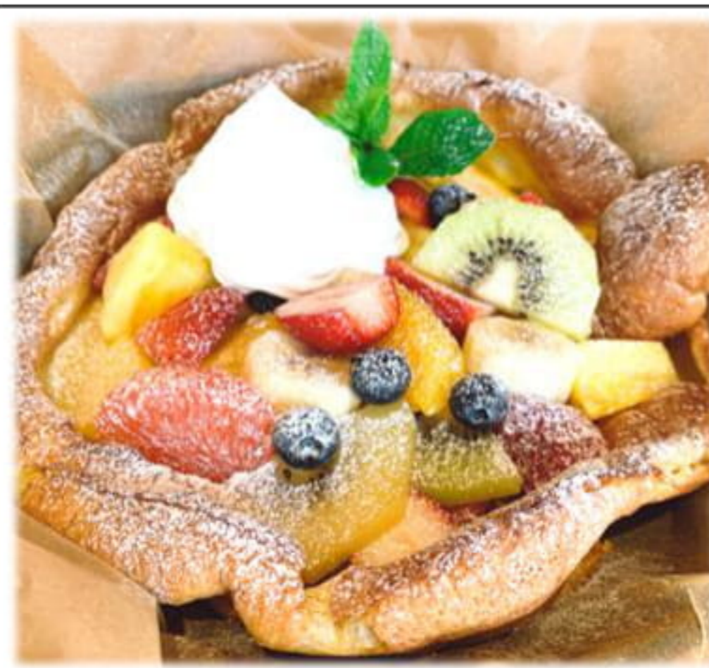
ダッチベイビー 純生クリームと ハニーメープルソース付