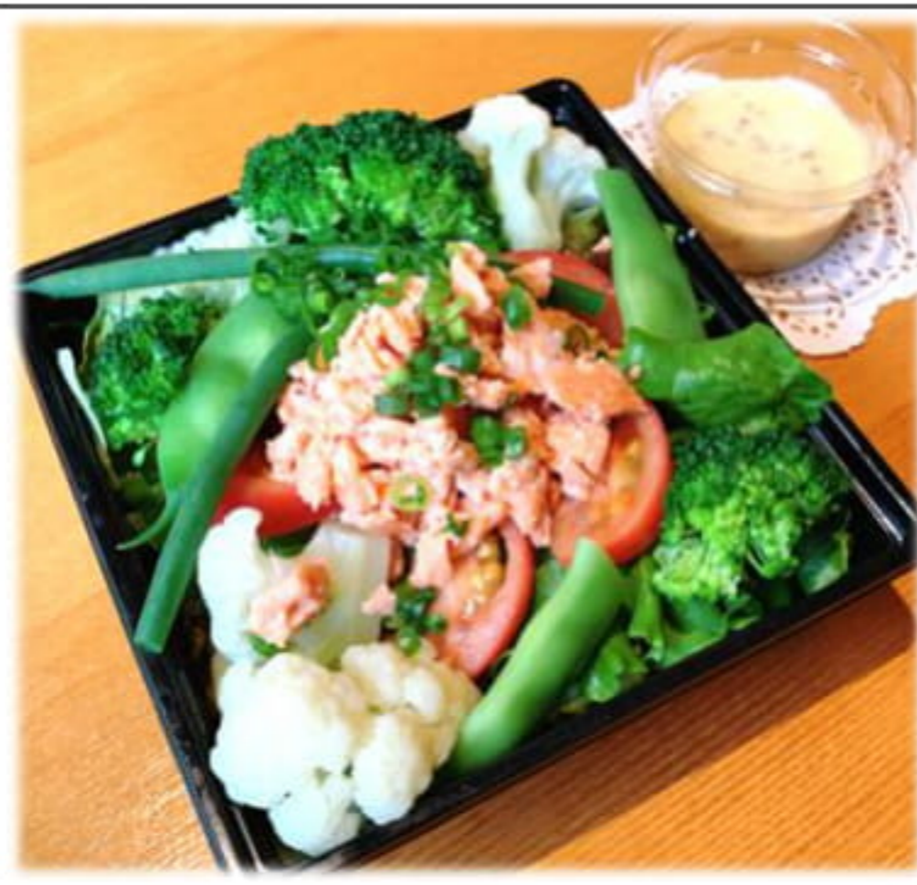
飯田風サラダ アルプスサーモンの コンフィと地元野菜