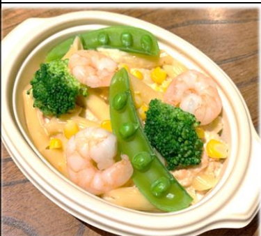
クリーム・ペンネ アルプスサーモンと海老 700円