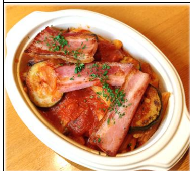
ラタトゥイユ・ペンネ 夏野菜のトマト煮 700円