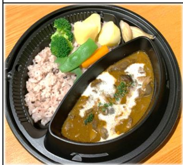
ビーフストロガノフ 弁当 800円