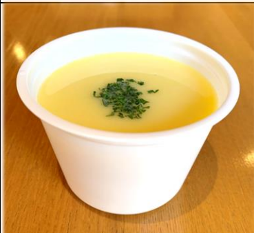
とうもろこしのスープ (温 or 冷) 300円