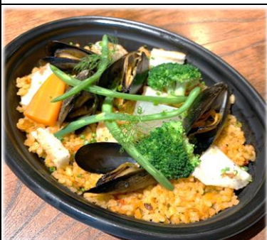
鶏と魚介のパエリア 800円