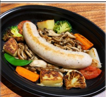
自家製ソーセージと 野菜のホットサラダ 800円