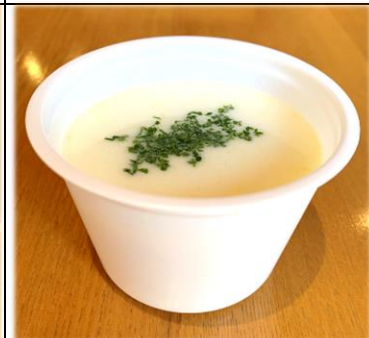
じゃがいものスープ (温 or 冷) 300円