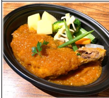
鶏のビネガー煮込み 1000円