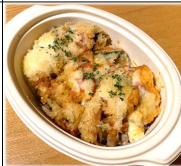
子羊と野菜の グラタン風 700円