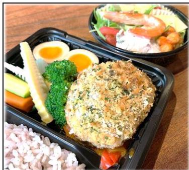
美城のビストロ弁当 食材はシェフおまかせ 1200円