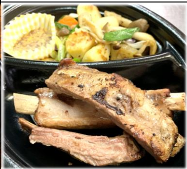
イベリコ豚 スペアリブのロースト 1200円