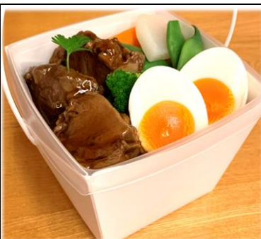
豚タンの角煮風弁当 800円