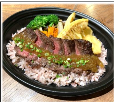
美城のステーキ弁当 1200円