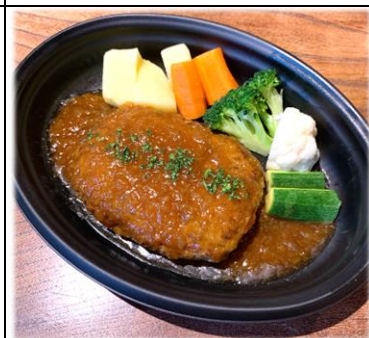
黒毛和牛ハンバーグ デミグラスソース 1000円