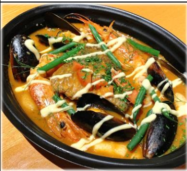
魚介のブイヤベース 1500円