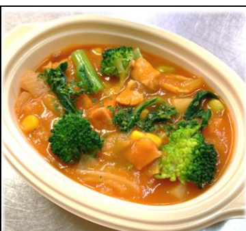
たべるトマトスープ 450円