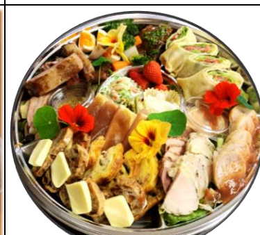
オードブルの盛り合わせ 5000円～ 3日前までのご予約を お願いいたします