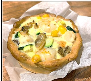
魚介と夏野菜の キッシュ 450円