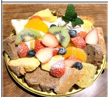
フルーツシフォン 純生クリーム入り 850円