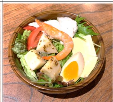
おまかせミニサラダ 400円