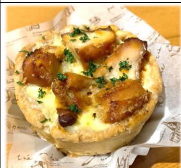
鶏とリゾットの キッシュ 450円