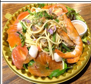
魚介の 冷製パスタサラダ 1000円