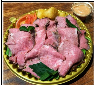
ローストビーフ サラダ仕立て 1000円