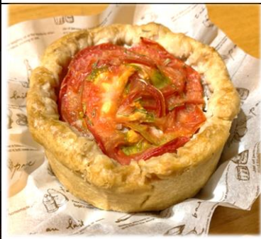
豚とトマトのタルト 450円