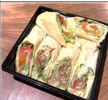
サラダクレープ アルプスサーモンと豚肉 700円