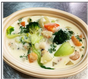
たべる魚介の クリームスープ 450円