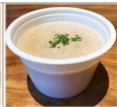
きのこのスープ 300円