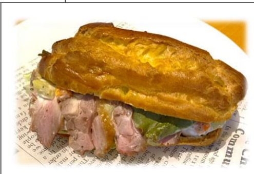
シューサンド 信州黄金シャモ 500円