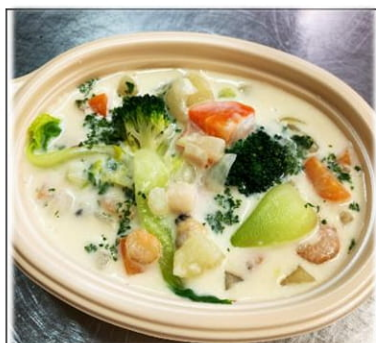
たべる魚介の クリームスープ 500円