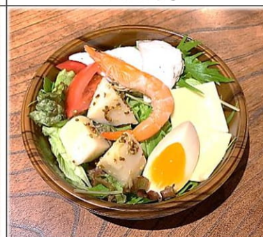
おまかせミニサラダ 400円