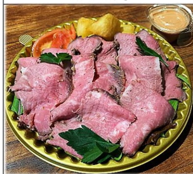
ローストビーフ サラダ仕立て 1000円