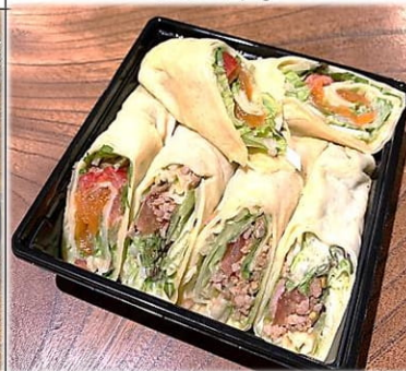
サラダクレープ アルプスサーモンと豚肉 700円