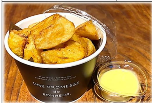
ポム・フリット 美城オリジナルフライドポテト 500円