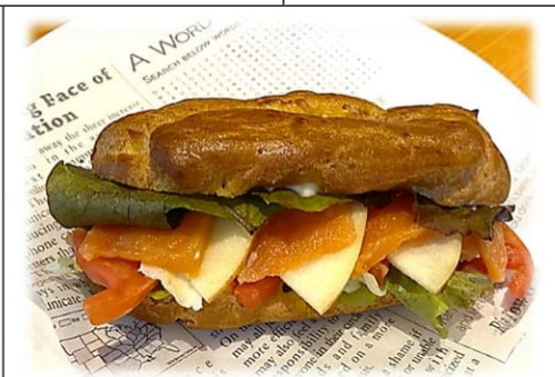
シューサンド スモークアルプスサーモン 500円