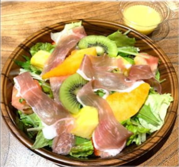
生ハムとフルーツの サラダ 600円