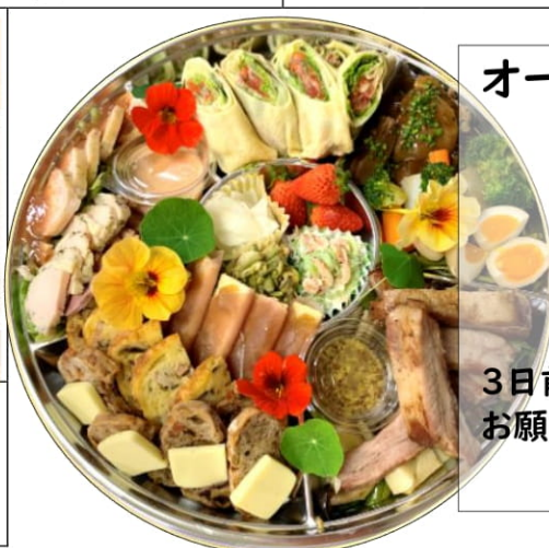
オードブルの 盛り合わせ 5000円