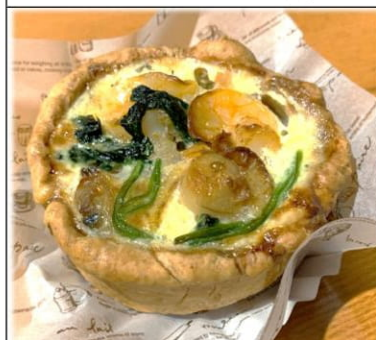
魚介とほうれん草の キッシュ 450円