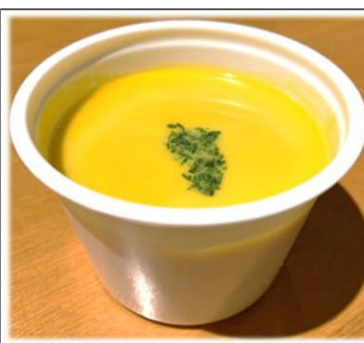
かぼちゃのスープ 300円